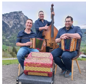
Musica popolare svizzera Echo vom Wurmloch

Cover Band Rolling Barrels https://therollingbarrels.ch